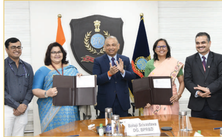
बीपीआरएंडडी मुख्यालय और एनएफएसयू के साथ समझौता ज्ञापन पर हस्ताक्षर के दौरान वरिष्ठ अधिकारीगण