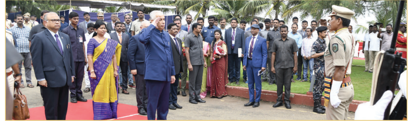
राज्यों और केंद्र शासित प्रदेशों की जेलों के प्रमुखों के दो दिवसीय 8वें राष्ट्रीय सम्मेलन के समापन समारोह पर आंध्र प्रदेश के माननीय राज्यपाल, श्री एस अब्दुल नजीर जी गार्ड की सलामी लेते हुए

राज्यों और केंद्र शासित प्रदेशों की जेलों के प्रमुखों का दो दिवसीय 8वां राष्ट्रीय सम्मेलन दिनांक 12 सितंबर, 2023 को संपन्न हुआ। आंध्र प्रदेश के माननीय राज्यपाल, श्री एस अब्दुल नजीर ने विशाखापत्तनम में आंध्र प्रदेश की माननीय गृह मंत्री, सुश्री तनेती वनिता की गरिमामयी उपस्थिति में समापन भाषण दिया। तकनीकी सत्रों के दौरान प्रतिनिधियों ने व्यापक विचार-विमर्श किया, जिनमें प्रमुख थे, कैदियों की नशामुक्ति, भारत की जेलों में मानसिक स्वास्थ्य की स्थिति, सुधारात्मक प्रशासन में प्रौद्योगिकी, जेलों में भीड़भाड़, कारावास का विकल्प, जेलों में महिलाएं और बच्चे-विशेष महिला जेल खूबियाँ और चुनौतियाँ जैसे विषय रहे। सम्मेलन में 24 राज्यों और 6 केंद्र शासित प्रदेशों के 100 से अधिक प्रतिनिधियों ने भाग लिया। ●