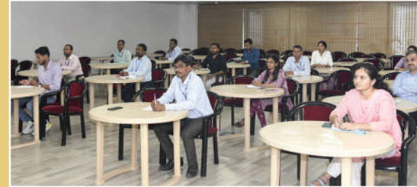
हिंदी टिप्पण, मसौदा लेखन एवं सामान्य ज्ञान प्रतियोगिता में शामिल प्रतिभागियों