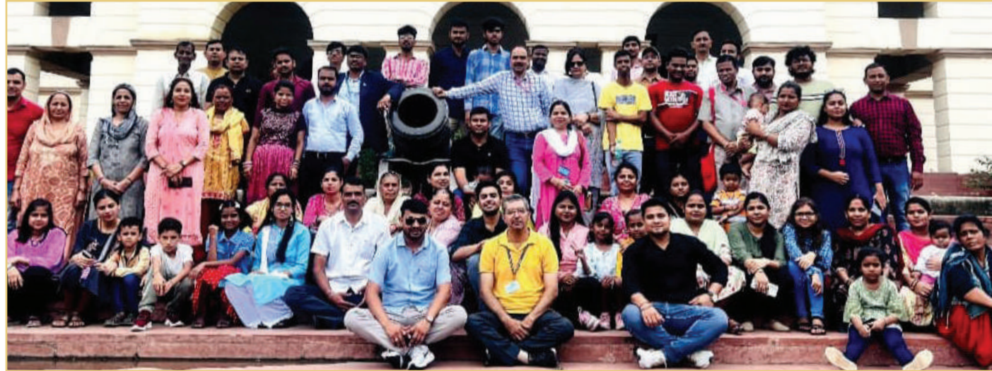
प्रधानमंत्री संग्रहालय में पारिवारिक यात्रा का समूह फोटोग्राफ

दिनांक 29 जुलाई, 2023 को प्रधानमंत्री संग्रहालय, नई दिल्ली और राष्ट्रीय युद्ध स्मारक की यात्रा के लिए बीपीआरएंडडी अधिकारियों और कर्मचारियों के लिए एक पारिवारिक यात्रा का आयोजन किया गया। कुल 82 अधिकारियों, कर्मचारियों और उनके परिवार के सदस्यों ने संग्रहालय और राष्ट्रीय युद्ध स्मारक का भ्रमण किया। ●