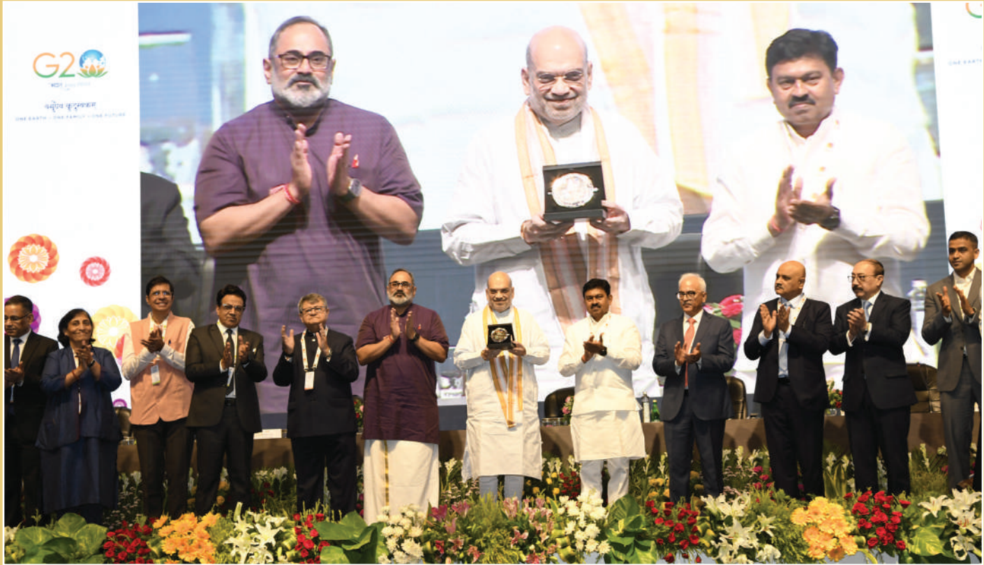
माननीय केंद्रीय गृह एवं सहकारिता मंत्री, श्री अमित शाह जी, एनएफटी, एआई और मेटावर्स के युग में अपराध और सुरक्षा: जी20 सम्मेलन के दौरान