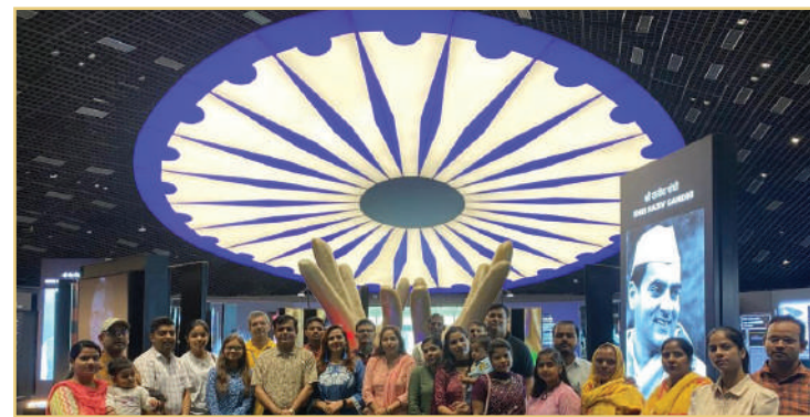
प्रधानमंत्री संग्रहालय में पारिवारिक यात्रा का समूह फोटोग्राफ