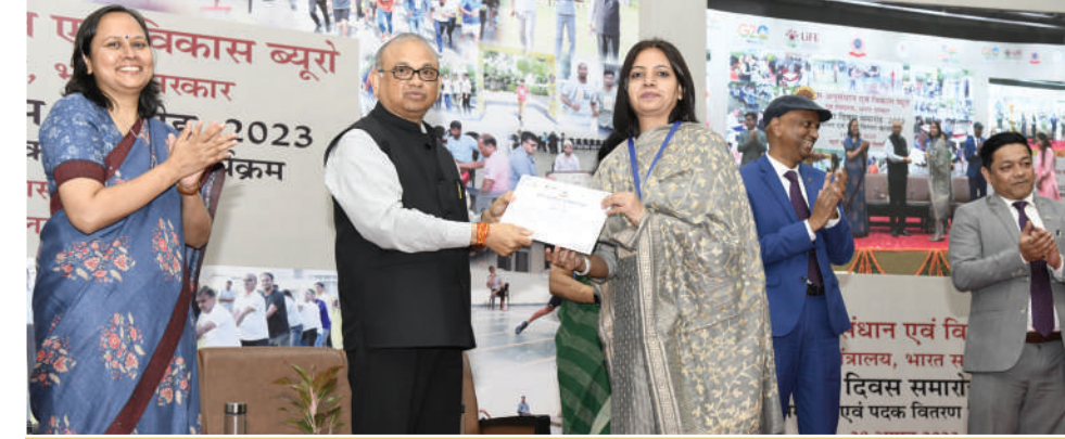
महानिदेशक, बीपीआरएंडडी प्रतियोगिताओं के विजेताओं को पुरस्कृत करते हुए

दिनांक 28 अगस्त, 2023 को पुलिस अनुसंधान एवं विकास ब्यूरो के 53वें स्थापना दिवस एवं पुरस्कार वितरण समारोह आयोजित किया गया। समारोह की अध्यक्षता ब्यूरो के महानिदेशक महोदय ने की। इसमें बीपीआरएंडडी के सभी अधिकारियों और कर्मचारियों ने भाग लिया। इस अवसर पर महानिदेशक महोदय ने सभी अधिकारियों एवं कर्मियों को बधाई दी तथा ब्यूरो में दिनांक 14 अगस्त, 2023 से 28 अगस्त, 2023 तक आयोजित विभिन्न प्रतियोगिताओं के विजेताओं को पुरस्कृत किया। ●