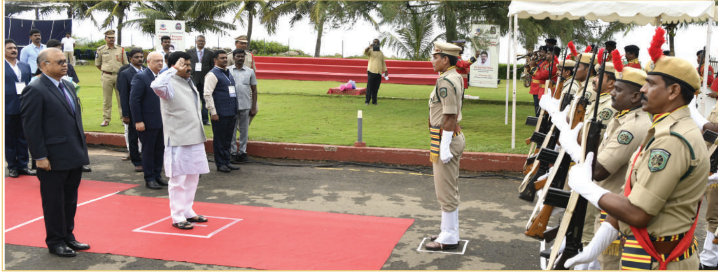
राज्यों/केंद्र शासित प्रदेशों के जेल प्रमुखों के 8वें राष्ट्रीय सम्मेलन में मुख्य अतिथि माननीय केंद्रीय गृह राज्य मंत्री, श्री अजय कुमार मिश्रा जी का स्वागत