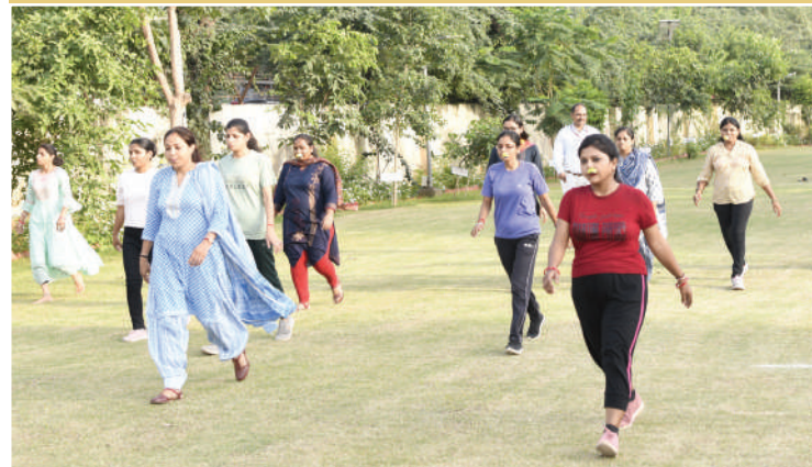
नीबू और चम्मच दौड़ के दौरान महिला प्रतिभागी