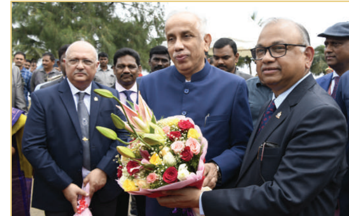
महानिदेशक, बीपीआरएंडडी, माननीय राज्यपाल, आंध्र प्रदेश, श्री एस अब्दुल नजीर जी का स्वागत करते हुए