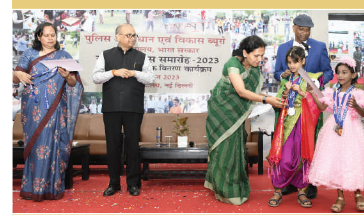
अपर महानिदेशक, बीपीआरएंडडी बच्चों को मेडल और प्रशंसा प्रमाणपत्र से पुरस्कृत करते हुए