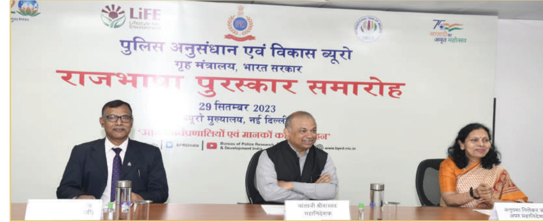
महानिदेशक, अपर महानिदेशक एवं अपर निदेशक (एसपीडी), बीपीआरएंडडी, राजभाषा पुरस्कार समारोह के दौरान

हिन्दी पखवाड़े का समापन तथा राजभाषा पुरस्कार वितरण समारोह