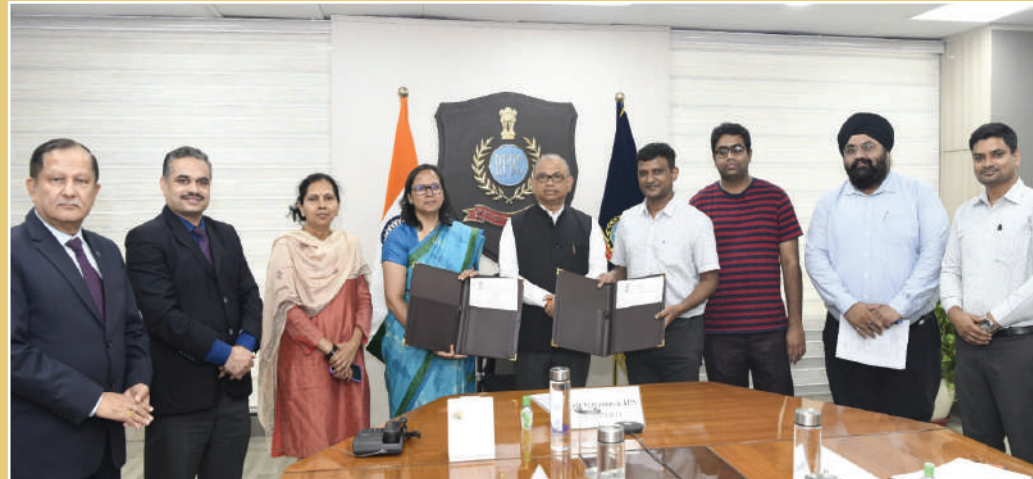
समझौता ज्ञापन के दौरान वरिष्ठ अधिकारियों

आईपी एड्रेस एनालाइजर (आरडी 003) निष्पादन और सहयोग पर समझौता ज्ञापन