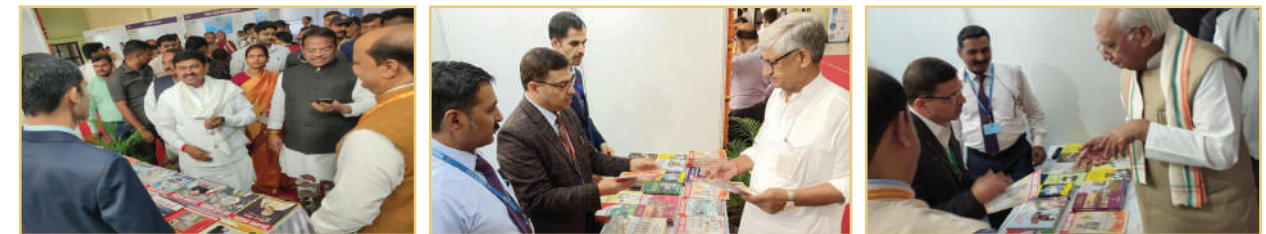
माननीय केंद्रीय गृह राज्य मंत्री, श्री अजय कुमार मिश्रा जी ब्यूरो द्वारा लगाए गए स्टॉल का भ्रमण करते हुए