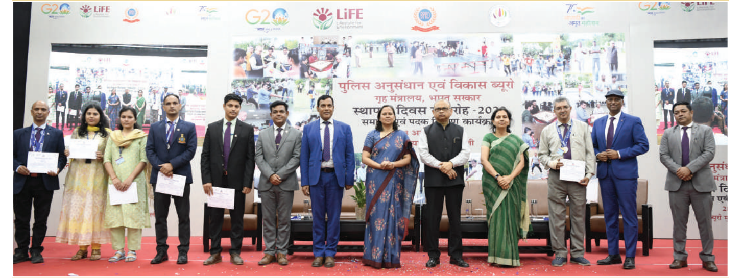
महानिदेशक, बीपीआरएंडडी प्रतियोगिताओं के विजेताओं के साथ