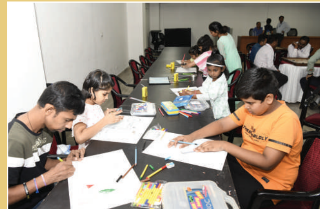
चित्रकला प्रतियोगिता के दौरान बच्चे