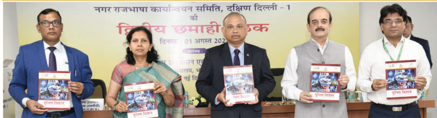
ब्यूरो द्वारा प्रकाशित छमाही हिंदी पत्रिका 'पुलिस विज्ञान' के 147वें अंक का विमोचन