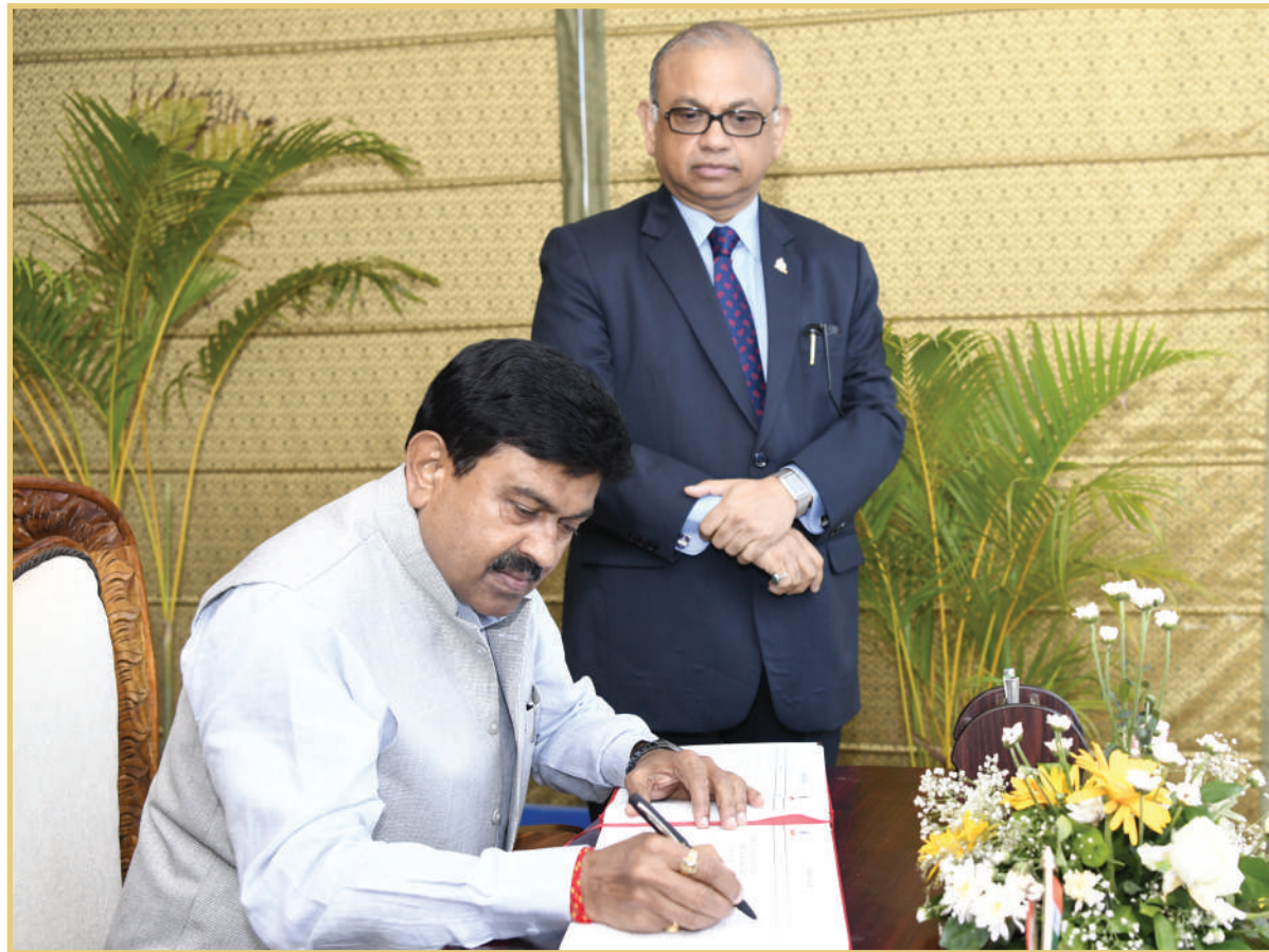
मुख्य अतिथि माननीय केंद्रीय गृह राज्य मंत्री, श्री अजय कुमार मिश्रा जी, बीपीआरएंडडी आगतुक पुस्तिका पर अपने विचार व्यक्त करते हुए