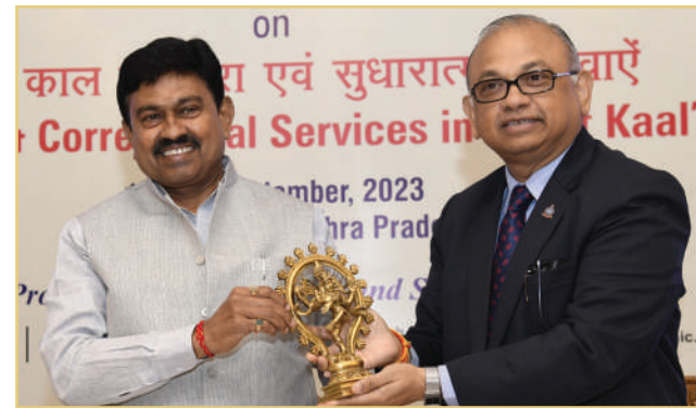
महानिदेशक, बीपीआरएंडडी, मुख्य अतिथि माननीय केंद्रीय गृह राज्य मंत्री, श्री अजय कुमार मिश्रा जी को स्मृति चिन्ह भेंट करते हुए