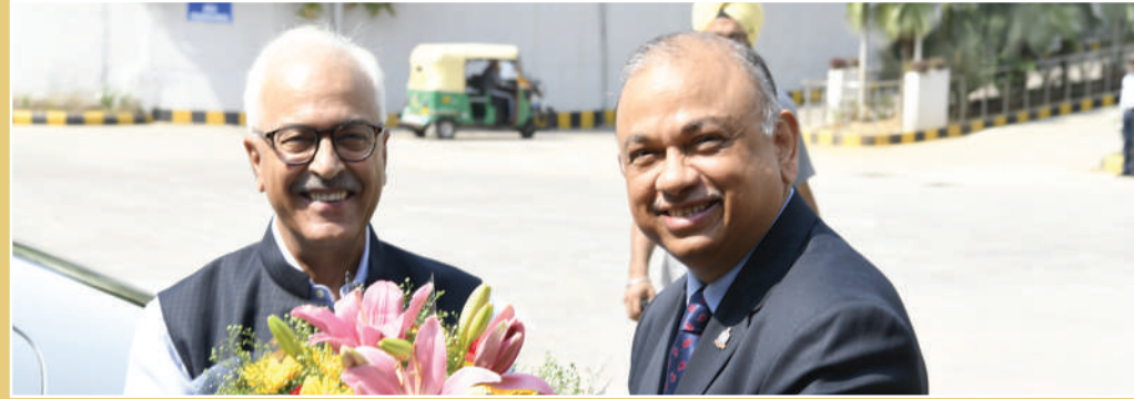
महानिदेशक महोदय द्वारा मुख्य अतिथि माननीय केंद्रीय गृह सचिव, श्री अजय कुमार भल्ला जी का बीपीआरएंडडी मुख्यालय में स्वागत

दिनांक 05 सितंबर, 2023 को पुलिस अनुसंधान एवं विकास ब्यूरो का 53वां स्थापना दिवस समारोह आयोजित किया गया जिसके मुख्य अतिथि माननीय केंद्रीय गृह सचिव, श्री अजय कुमार भल्ला जी थे। इस अवसर पर माननीय मुख्य अतिथि ने इंडियन पुलिस जनरल के दो संस्करणों का विमोचन किया तथा केन्द्रीय गृह मंत्री की प्रशिक्षण ट्रॉफी से विभिन्न श्रेणी में संस्थान के निर्देशकों को ट्रॉफी प्रदान की। इस अवसर पर ब्यूरो के कार्यों की सराहना करते हुए मुख्य अतिथि ने माननीय केंद्रीय गृह एवं सहकारिता मंत्री श्री अमित शाह जी के इस वाक्य को दोहराया की बीपीआरएंडडी के बिना अच्छे पुलिसिंग की कल्पना नहीं की जा सकती। ●