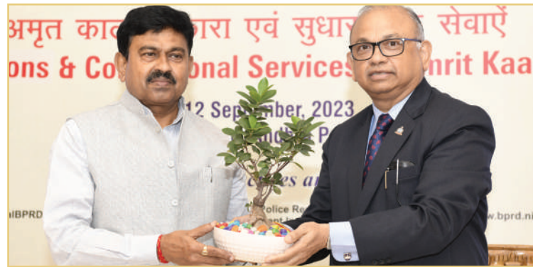
महानिदेशक, बीपीआरएंडडी मुख्य अतिथि माननीय केंद्रीय गृह राज्य मंत्री, श्री अजय कुमार मिश्रा जी का समारोह में स्वागत करते हुए