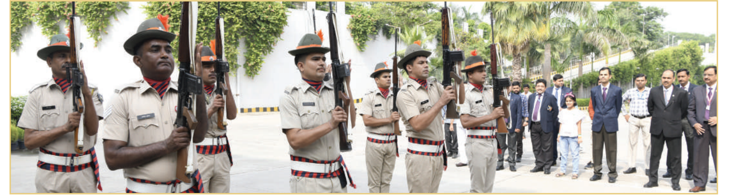
77वें स्वतंत्रता दिवस के अवसर पर बीपीआरएंडडी मुख्यालय में आयोजित समारोह

बीपीआरएंडडी मुख्यालय एवं अधीनस्थ इकाइयों में दिनांक 15 अगस्त, 2023 को 77वां स्वतंत्रता दिवस मनाया गया। इस समारोह में ब्यूरो के सभी अधिकारी/कर्मचारी शामिल हुए और उसके पश्चात मिठाई का वितरण किया गया। ●