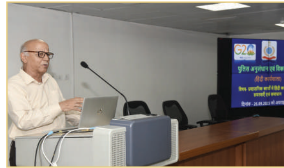
प्रशासनिक कार्य में हिंदी का उपयोग-समस्या एवं समाधान विषय पर चर्चा

पुलिस अनुसंधान एवं विकास ब्यूरो मुख्यालय में हिंदी पखवाड़े के अंतर्गत 'प्रशासनिक कार्य' में हिंदी का उपयोग-समस्या एवं समाधान विषय पर एक कार्यशाला दिनांक 26 सितंबर, 2023 को एवं "राजभाषा हिंदी में तकनीकी लेखन /कार्य" की विशेष कार्यशाला दिनांक 27 सितंबर, 2023 को आयोजित की गई। जिसमें मुख्यालय के अधिकारी एवं कार्मिक व्यक्तिगत रूप से तथा बाह्य संस्थाओं के अधिकारी एवं कार्मिक वेब के माध्यम से जुड़े। ●