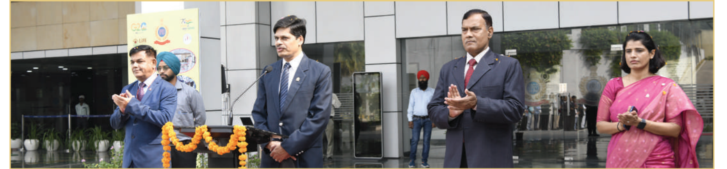
77वें स्वतंत्रता दिवस के अवसर पर बीपीआरएंडडी मुख्यालय में अधिकारीगण