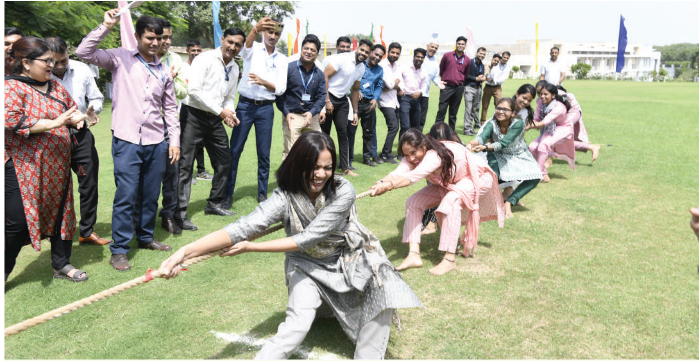
रस्साकशी के दौरान महिला प्रतिभागी