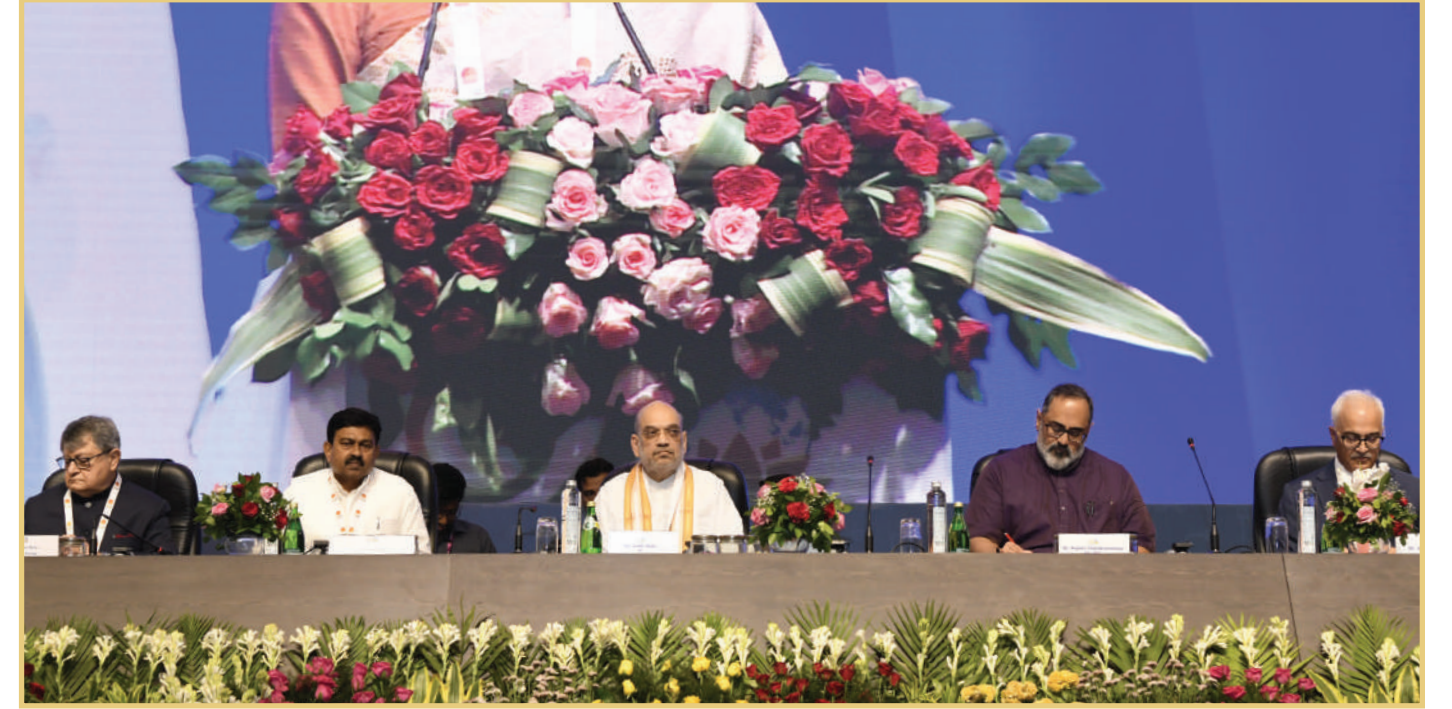
माननीय केंद्रीय गृह एवं सहकारिता मंत्री, श्री अमित शाह जी साइबर सुरक्षा पर, जी20 सम्मेलन की अध्यक्षता करते हुए

दिनांक 13 जुलाई, 2023 को महानिदेशक, बीपीआरएंडडी, अपर महानिदेशक, बीपीआरएंडडी, निदेशक, सीएपीटी भोपाल, और निदेशक (आधुनिकीकरण) ने ब्यूरो के वरिष्ठ अधिकारियों के साथ एनएफटी, एआई और मेटावर्स के युग में अपराध और सुरक्षा पर जी20 सम्मेलन में भाग लिया। जिसका उद्घाटन माननीय केंद्रीय गृह एवं सहकारिता मंत्री, श्री अमित शाह जी द्वारा किया गया। बीपीआरएंडडी के तहत NCR&IC ने CCPWC योजना के तहत 6 संस्थानों के 20 उपकरणों को प्रदर्शित करने वाला एक स्टॉल भी स्थापित किया। ●