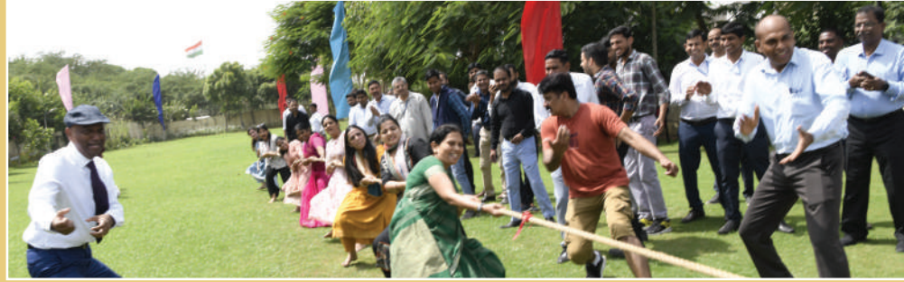
रस्साकशी के दौरान महिला प्रतिभागी