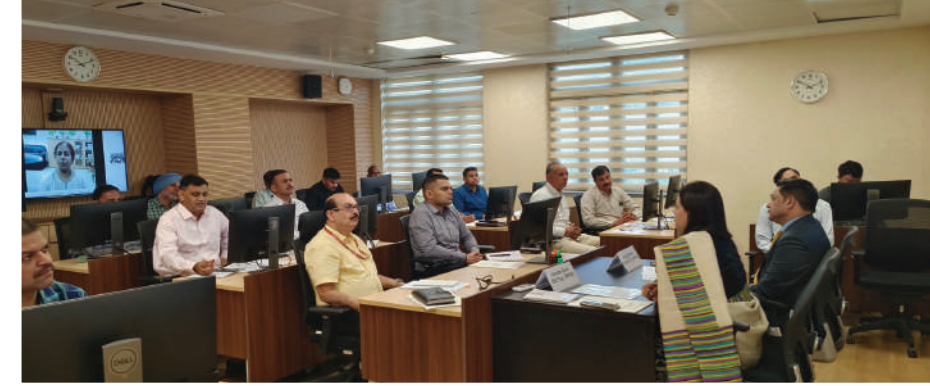
निदेशक (प्रशिक्षण) और उपनिदेशक (प्रशिक्षण) पाठ्यक्रम के दौरान प्रतिभागियों को प्रशिक्षण देते हुए

आंतरिक सुरक्षा पर 6वें अंतरिक्ष – आधारित अनुप्रयोग पर प्रशिक्षण पाठ्यक्रम