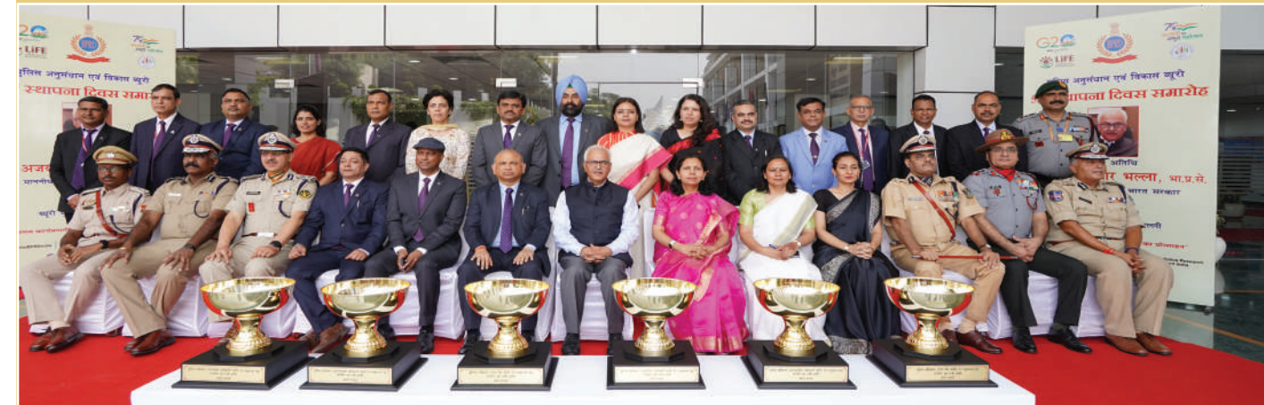
सर्वश्रेष्ठ संस्थान के लिए केंद्रीय गृह मंत्री ट्रॉफी के विजेताओं के साथ समूह फोटोग्राफ

दिनांक 28 अगस्त, 2023 को पुलिस अनुसंधान एवं विकास ब्यूरो के 53वें स्थापना दिवस एवं पुरस्कार वितरण समारोह आयोजित किया गया। समारोह की अध्यक्षता ब्यूरो के महानिदेशक महोदय ने की। इसमें बीपीआरएंडडी के सभी अधिकारियों और कर्मचारियों ने भाग लिया। इस अवसर पर महानिदेशक महोदय ने सभी अधिकारियों एवं कर्मियों को बधाई दी तथा ब्यूरो में दिनांक 14 अगस्त, 2023 से 28 अगस्त, 2023 तक आयोजित विभिन्न प्रतियोगिताओं के विजेताओं को पुरस्कृत किया। ●