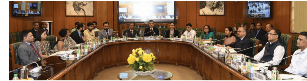
केन्द्रीय गृह मंत्रालय में साइबर सुरक्षा हैकथॉन, क्वच-2023 के ग्रैंड फिनाले के समापन समारोह के अवसर पर वरिष्ठ अधिकारीगण