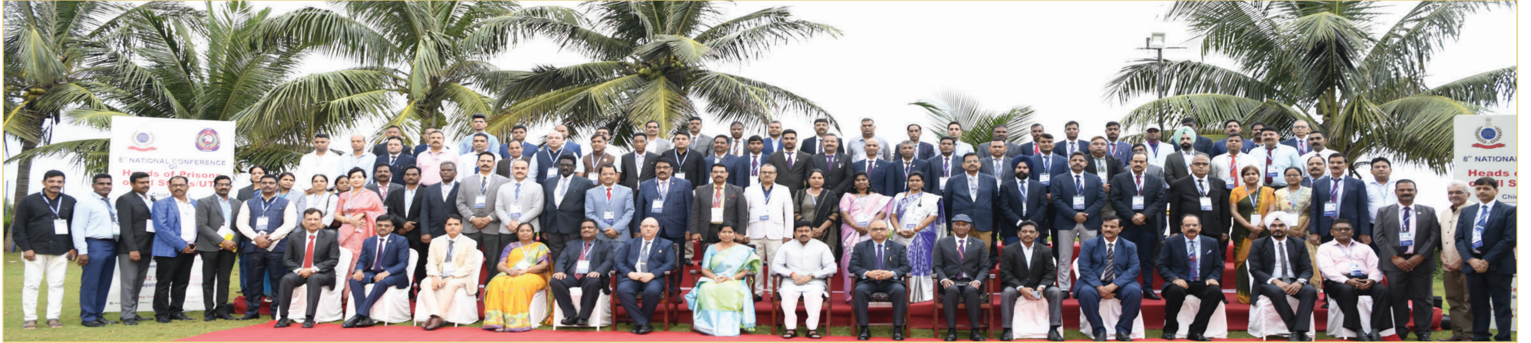
राज्यों/केंद्रशासित प्रदेशों के जेल प्रमुखों के 8वें राष्ट्रीय सम्मेलन का समूह फोटोग्राफ