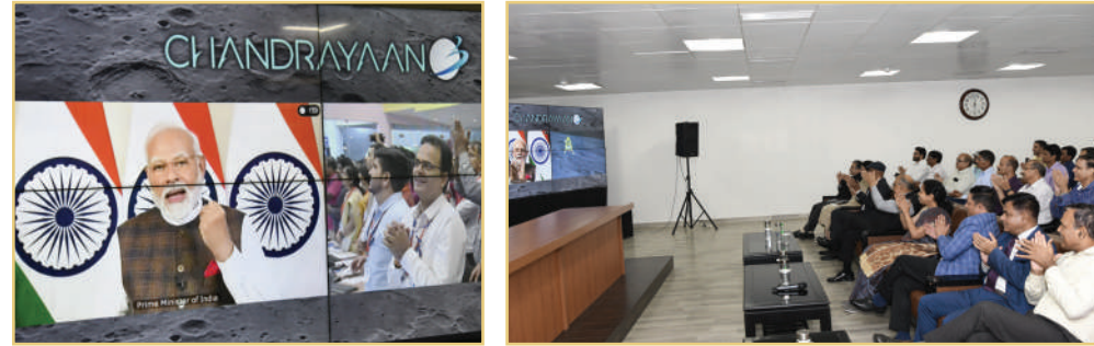
ब्यूरो मुख्यालय में चंद्रयान मिशन-3 की लैंडिंग का सीधा प्रसारण

चंद्रयान मिशन-3 देश की अभूतपूर्व उपलब्धि