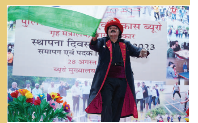
बीपीआरएंडडी के 53वें स्थापना दिवस समारोह के अवसर पर मैजिक शो का आयोजन