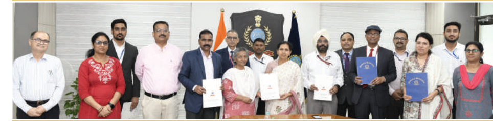
समझौता ज्ञापन पर हस्ताक्षर के दौरान वरिष्ठ अधिकारीगण

'उन्नति @ तिहाड़' अनुसंधान अध्ययन के लिए एक समझौता ज्ञापन