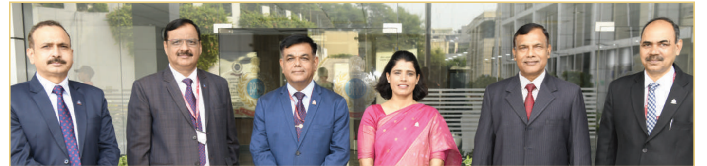
77वें स्वतंत्रता दिवस के अवसर पर बीपीआरएंडडी मुख्यालय में अधिकारीगण