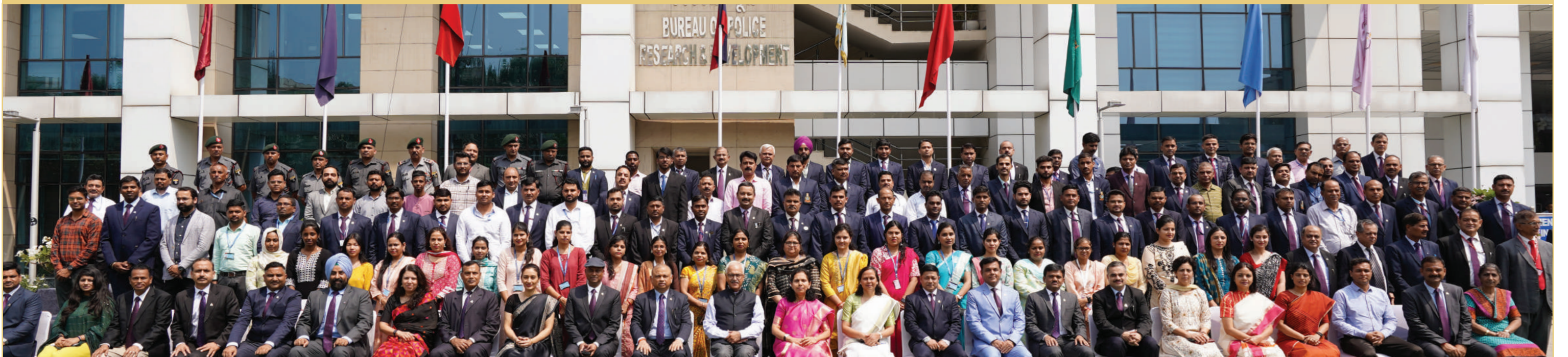
53वां बीपीआरएंडडी स्थापना दिवस समारोह का समूह फोटोग्राफ