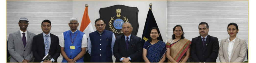
साइबर सुरक्षा हैकथॉन क्वच-2023 के ग्रैंड फिनाले के अवसर पर वरिष्ठ अधिकारीगण