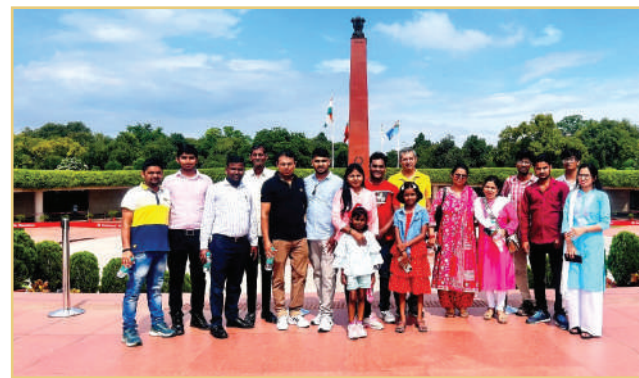
राष्ट्रीय युद्ध स्मारक में पारिवारिक यात्रा का समूह फोटोग्राफ