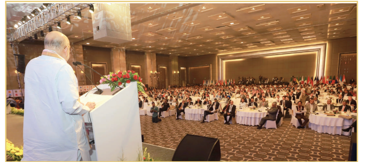
माननीय केंद्रीय गृह एवं सहकारिता मंत्री, श्री अमित शाह जी, जी20 सम्मेलन में उपस्थित वैश्विक विशेषज्ञों एवं अधिकारियों को संबोधित करते हुए